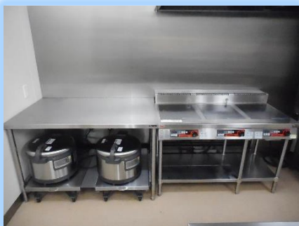
熱効率が良く、直火を使わない ので周囲が暑くならない IH炊飯器（左）とIH調理器（右）