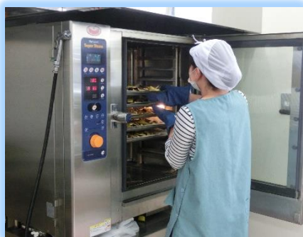
焼く・煮る・蒸すも簡単なスチーム コンベクションオープン