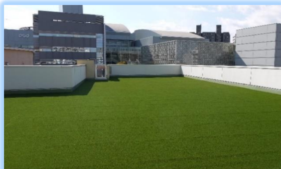
当園は町中にあり園庭が広く取れないため、園舎屋上 にふっかふかの人工芝広場を設置 （後方は大分県立美術館OPAM）