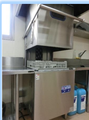
自動食器洗浄機で後片付けも スムーズ