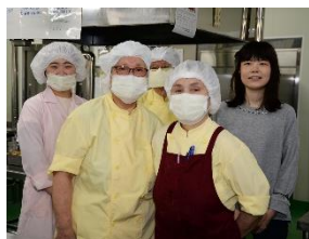
栄養士さん、調理担当のみなさん