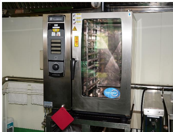
1台で焼く・煮る・蒸すも簡単なスチームコンベクションオープン