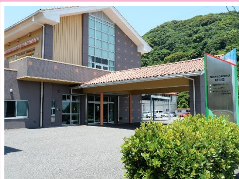
高齢者総合福祉施設 緑の園 玄関

緑の園は、特別養護老人ホーム、ショートステイセンター、デイサービスセンターなどを併設した高齢者総合福祉施設で、昭和48年に設立し、平成23年に臼杵湾を望む現在の地に移転しました。