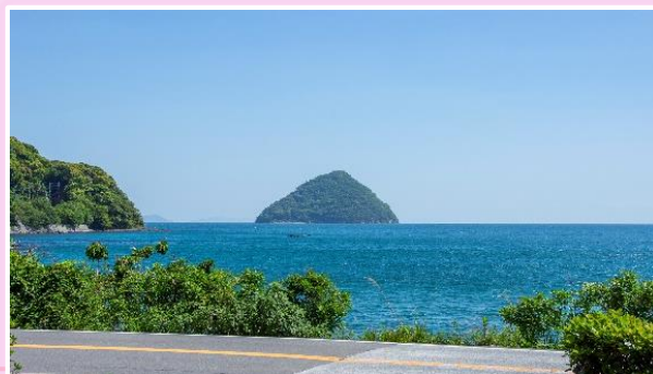
施設の前に広がる 臼杵湾