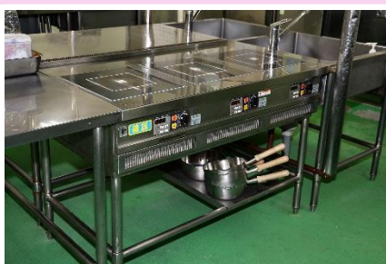
ハイパワーで使い勝手が良いIH調理器