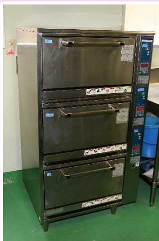
熱効率が高く、かまど焚きのご飯やお粥も炊き分ける立体炊飯器