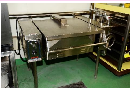
煮込み、炒め、蒸し物など幅広く使用できるブレージングパン