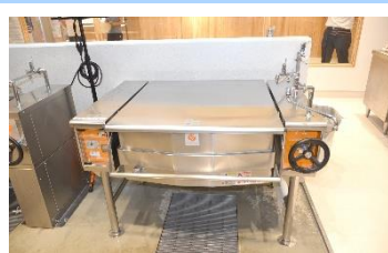
色々な料理に使える電気式 ブレイジングパン