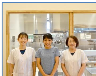
厨房スタッフの皆さん

電化厨房は、火を使わないため、安全だけでなく、鍋の周りの放熱も少ないので以前の職場と比べると夏の暑さも変わりました。また、電化厨房は想像以上に火力も強く、電気式スチコンは焼きムラも少なく、調理時間が鍋釜だけの調理に比べ半分くらいになりました。プラストチラーもつけてもらいましたが、夏は冷たい和え物やサラダも提供できるようになり、シャキシャキとした触感も残しつつ、食中毒防止にもつながりました。安心・安全・効率化を図れる電化厨房を導入してよかったと実感しています。