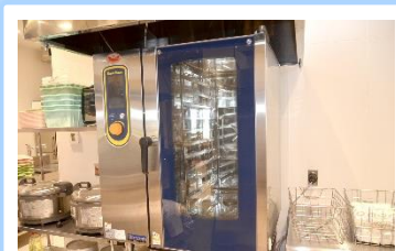
蒸し料理も可能な スチームコンベクションオープン