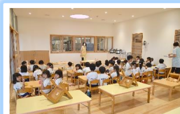
厨房は園児からも見えるように ガラス張りになっています