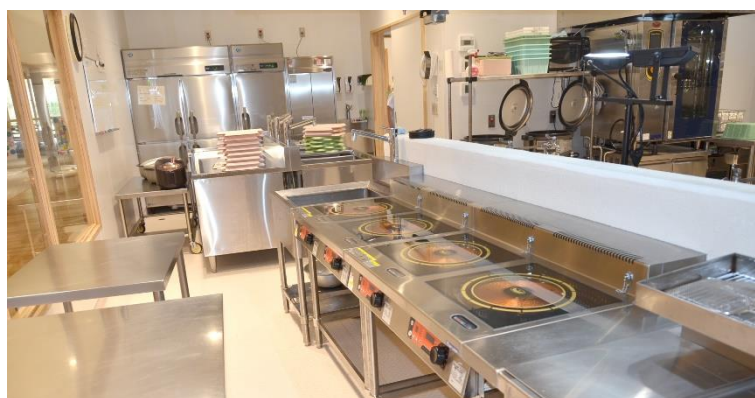
いつでも清潔な厨房環境を保っています