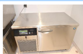
天板を作業台としても使える プラスチックラー