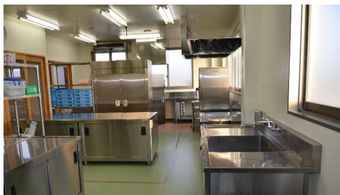
8年前の改築当時から変わらない、クリーンに保てる電化厨房