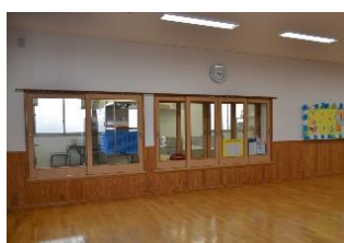
厨房との境界を園児目線に低くしたことで、園児が調理の音や匂いを五感で感じることができる給食室