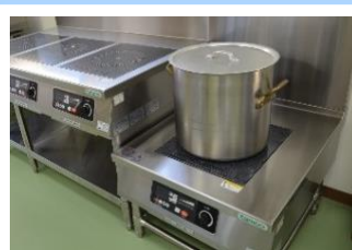
深さのある鍋でも調理しやすいIH調理器（ローレンジ）