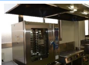
焼く・煮る・蒸すも簡単なスチームコンベクションオープン